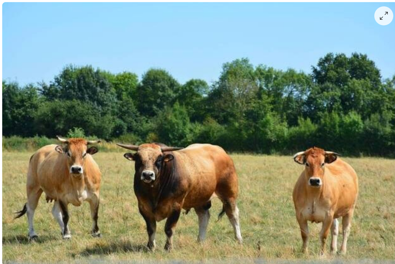
Le projet du PNR de Gâtine entre dans sa phase finale.

Optimiste le Pays de Gâtine ? « Ça avance très bien. À côté de ce travail de rédaction, de rencontres, nous avons toujours des actions de préfiguration : le plan paysage, et le guide d'entretien des haies qui s'accompagne de formations volontaires des agents communaux. En cette période d'inondation, on voit tout l'intérêt des haies », ajoute M. Cesbron. « Au final, ce que l'on veut, c'est que la Gâtine progresse. »